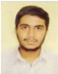
ಪನ್ನಗ ಹೆಗಡೆ(583) ಕಾಲೇಜ್: 3 rd