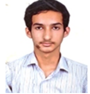
ಪೂರ್ಣಚಂದ್ರ ಹೆಗಡೆ(589/600) ರಾಜ್ಯ:10 th ,ಕಾಲೇಜ್:2 nd