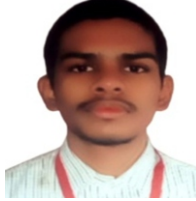
ಸುಕ್ಷಿತ ಅಗೇರಾ ಇಂಜಿನಿಯರಿಂಗ್: 3160