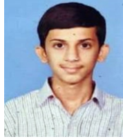
ಅಲೋಕ ಹೆಗಡೆ ಇಂಜಿನಿಯರಿಂಗ್: 6210

ವಾಣಿಜ್ಯ ವಿಭಾಗ ಫಲತಾಂಶ : 99.13% ರ್ಯಾಂಕ್ ವಿಜೇತರು