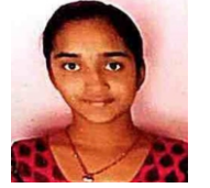
ಸೌಖ್ಯ ಪಿ ಎಂ(590) ರಾಜ್ಯ: 8 th , ಕಾಲೇಜ್:3 rd

ವಿಜ್ಞಾನ ವಿಭಾಗ ಫಲತಾಂಶ: 94% ರ್ಯಾಂಕ್ ವಿಜೇತರು