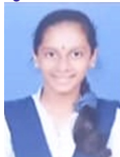
ಸ್ನೇಹಪ್ರೀ ಡಿ (577) ಕಾಲೇಜ್:2 nd