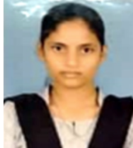
ಚಂದನಾ ಹೆಗಡೆ (586) ಕಾಲೇಜ್:2 nd